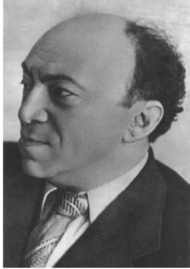
Последнее фото С. М. Михоэлса. Минск. 11 января 1948 г.

Так поползли по Москве слухи, поползли из кругов, близких к казненному. Например, кто-то из видевших обнаженный труп Михоэлса говорил, что на его теле не было иных повреждений, кроме височной раны. Это опровергало версию об автомобильном наезде. Значит, убийство. Но на руках убитого тикали золотые часы. Значит, не грабители. Были слухи, что расследовать это дело поручили знаменитому Льву Шейнину; он прибыл в