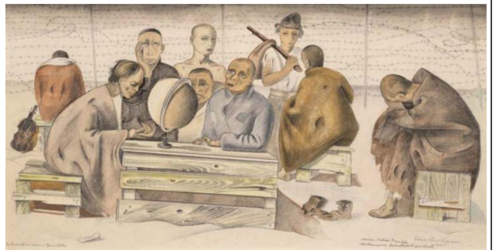
«В лагере Сен-Сиприен», 1941

В 1938 году Нуссбаум принимает участие в выставке в Париже вместе с членами Объединения свободных художников. Его картины были представлены в разделе «Свободное немецкое искусство», что явилось прямым вызовом состоявшемуся в это же время в Мюнхене нацистскому шоу под названием «Выродившееся искусство».